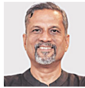
Sridhar Vembu, founder, Zoho

"We understand the push for Zoho to go public. But let me state the reality: Arattai would very likely not have been built by a public company that faces quarter-to-quarter